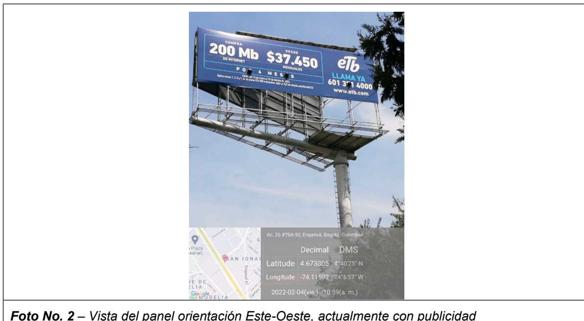
Foto No. 2 – Vista del panel orientación Este-Oeste, actualmente con publicidad